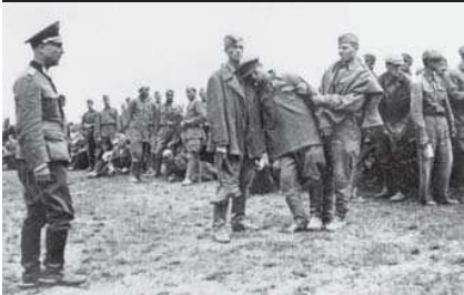
SOWJETISCHE KRIEGSGEFANGENE IM STALAG 333 IN KOMAROWO, VERMUTLICH VOR DEM ZÄHLEPELL